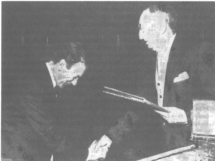
Abb. 1: „Einen Preis entgegennehmen heißt nicht anderes, als sich auf den Kopf machen zu lassen, weil man dafür bezahlt wird.“ – Thomas Bernhard bei der Verleihung des Bremer Literaturpreises. [Quelle: Emmerich, Der Bremer Literaturpreis (Anm. 20), S. 121, ]